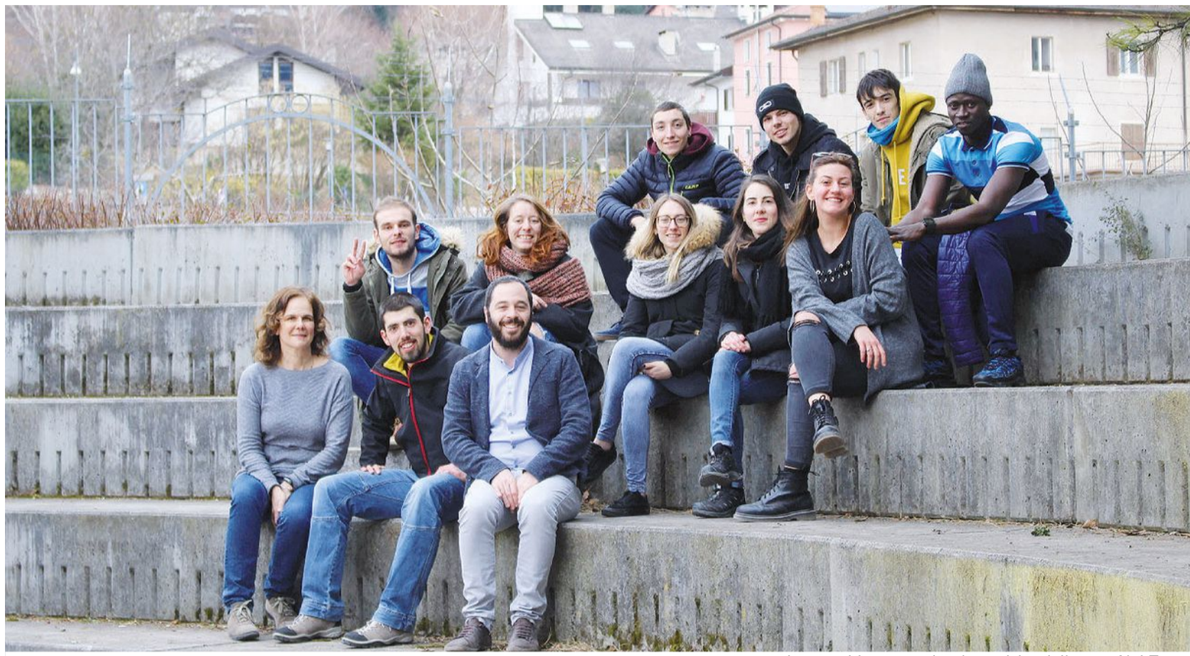
I ragazzi impegnati nel servizio civile con Noi Trento

Prima della pandemia, una delle iniziative proposte da Noi Trento era quella di offrire dei percorsi cinematografici per gli oratori. «Il cinema è uno strumento molto efficace e che si confà alla mission dell'oratorio - aggiunge lo stesso don Saiani -