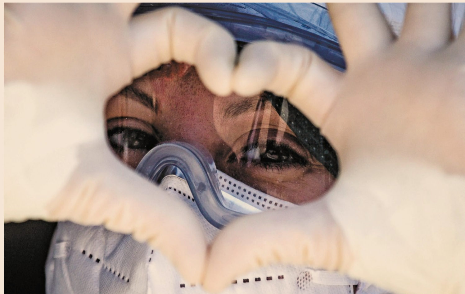
Sanità sotto pressione per il virus. Un'immagine 2020 tra quelle «che non dimenticheremo», scattata a maggio a Bergamo

Esami a rilento e oncologia: allarme sulla sanità non Covid