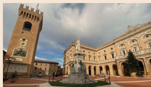
Sede della BCC di Recanati e Colmurano

Nella città de L'Infinito, all'interno di un triangolo culturale che comprende le storiche Università di Macerata (1290), Camerino (700 anni) ed Ancona, con radici nel 1500, si trova la bella sede della Banca di Credito Cooperativo di Recanati e Colmurano. Una Banca sempre vicina al Territorio. Dall'iniziale sostegno alle classi più deboli per il riscatto delle aree rurali, al ruolo di partner del vivace tessuto sociale ed imprenditoriale che esiste tra le province di Macerata ed Ancona, nel quale operano realtà produttive di respiro internazionale (illuminazione, plastica, mobile, calzature, strumenti musicali, editoria, meccanica), accanto ad una miriade di piccole imprese che supportano le più grandi con un innato ed inarrivabile spirito innovativo.