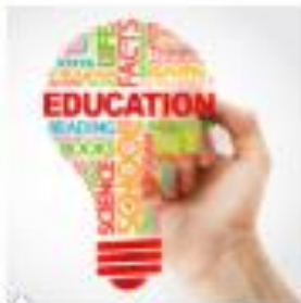
Istruzione e Formazione