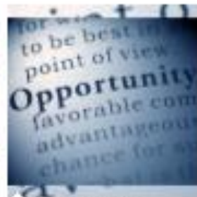
Bandi e Opportunità