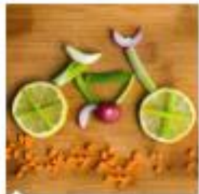
Sport e Benessere