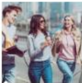
Europa e Mondo