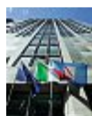
La sede Consiglio regionale

Quanto costano a Regioni e città italiane gli straordinari per il personale a tempo indeterminato? A rivelarne la spesa, sostenuta, ovviamente, dalle casse pubbliche, un report elaborato dalla Fondazione Gazzetta Amministrativa della Repubblica. La Campania è al primo posto.