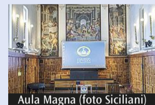
Aula Magna