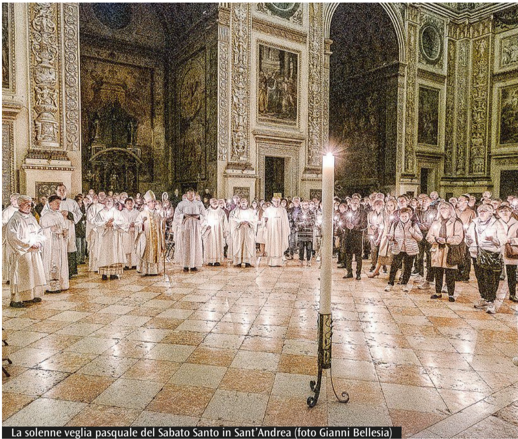
La solenne veglia pasquale del Sabato Santo in Sant'Andrea

da: non tanto una mancanza di "messe" (perdonate il gioco di parole), quanto una difficoltà a riconoscerla. Se ci siamo dimenticati come si alzano gli occhi allora c'è un primo compito da fare a casa : possiamo assumerci di nuovo la responsabilità di essere cristiani. Essere cristiani significa avere uno sguardo in-spirato , positivo. Significa sperare oltre l'invisibile, persino oltre la morte. Essere cristiano significa che sta a me vedere