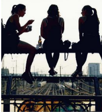
il Mulino Copertina del libro

Istituto Giuseppe Toniolo La condizione giovanile in Italia Rapporto Giovani 2026